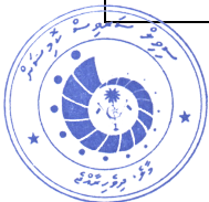
مرفق 3: الخطة العمل للدراسات والبحوث الاستراتيجية للعام 2024/3